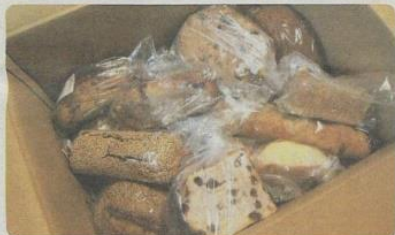
配送はロSPANが出たときのみなので、通常待ち人数が表示される。2~3週間待つこともあるが、翌日に冷凍で届くため、商品の状態はほかのお取り寄せパンとはほぼ変わらない