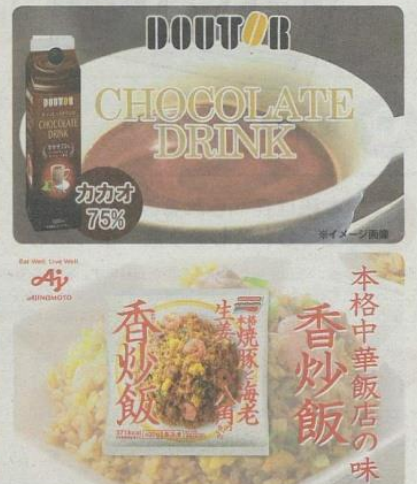
賞味期限の約1カ月前から数日前など580社以上が並ぶ。セット販売が中心なので職場などでシェアするのもおすすめです。また、支援先は複数あり、選択することも可能

飲料やレトルトなどの食品を中心に、販売終了商品や季節商品、賞味期限近の商品を最大97%オフで販売。本来廃棄されてしまっていた商品を販売し、「もったいないを価値へ」変えていくサービスです。購入金額の一部は世界の食糧問題の解決に取り組むNPO法人などに寄付される。今後はオンラインでも購入できる場の提供や、農家の未収穫商品の収穫支援などの取り組みを予定しています。