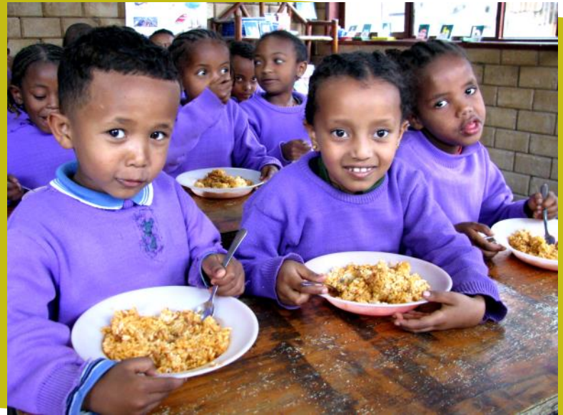
▲給食大好き！（エチオピアの子ども達）

この幼稚園には現在120人の子どもが通っています。歌をうたったり、文字を学んだりするのはもちろん、子ども達が毎日とても楽しみにしているのが、みんなで食べる給食です。お昼になると、みんなきちんと一列に並んで一人ずつお皿を受け取っていきます。栄養たっぷりの食事が成長を支えるだけでなく、幼稚園の出席率の向上にもつながっています。