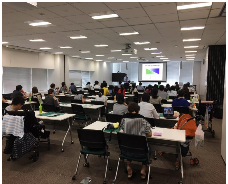
8月5日 大日本住友製薬東京本社にて開催。 基礎医学の勉強会でしたが総勢70名もの方々にご参加頂きました。

皆様からのご支援のお蔭で研究を進める事が出来ております。 本当に有難う御座います！