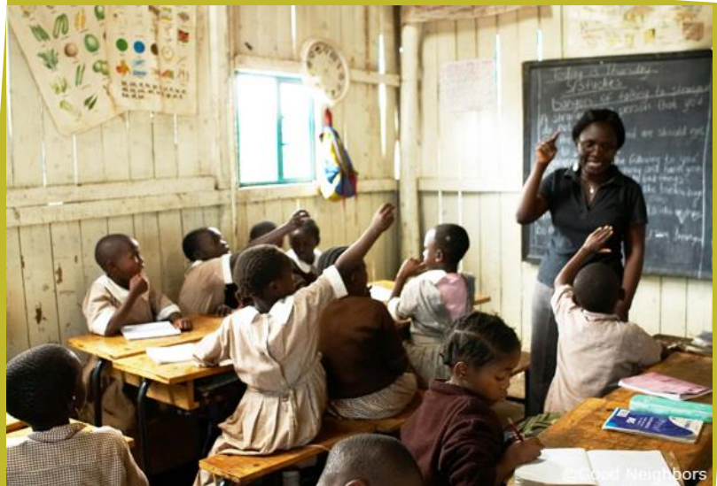
▲教育センターで勉強する子ども達(ケニア)

グッドネーバーズはコロゴチョに教育センターを設置し、学校に行けない子ども達を支援しています。授業を受ける姿はみな真剣で、先生の質問にも積極的に答えます。「先生になりたい」「お医者さんになりたい」そんな夢を持ちながら日々勉強に励む子ども達。スラム街という厳しい環境にいるからこそ、教育という希望が必要です。グッドネーバーズは子ども達の学習に欠かせない学用品セット(ノート、ペン、鉛筆、チョークなど)を提供して、子ども達の夢を応援しています。