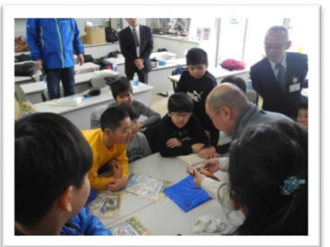
ハサミを使った魚のさばき方を学ぶ