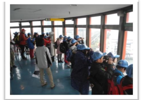
船の科学館展望塔から東京湾と船の観察