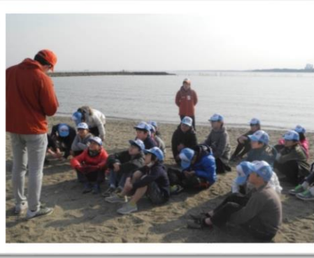
東京の海の環境保護を考える