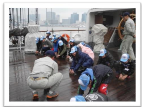
帆船海王丸で船員体験