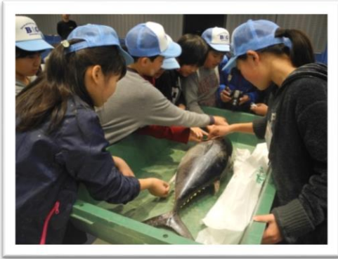
水族館でマグロの生態を学ぶ