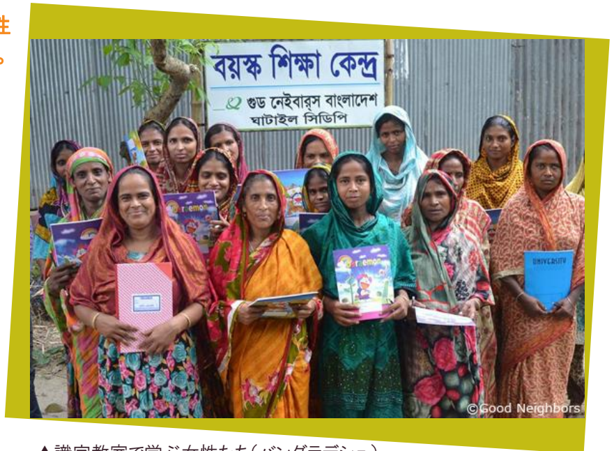
▲識字教室で学ぶ女性たち(バングラデシュ)

教室には、子どもの頃学校に行けなかったなど、様々な理由で読み書きができないお母さん達が集まります。初めは「私には無理だから」と戸惑う女性も多いのですが、先生の応援に励まされ「子どものためにも」と懸命に学んでいます。