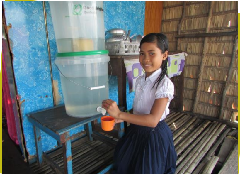
▲家族の健康を守る安全な水(カンボジア)

カンボジアで例年実施している浄水器の支援事業。家庭に一台、家庭用浄水器を届け、家族が安全でおいしい水を飲めるように支援しています。2016年には、グッドネーバーズが活動するコーチバンという地域で、水上生活を営む村の164世帯へ浄水器を提供しました。水質検査や配布後の利用状況などを評価し、改善を重ねています。また、安全な水に対する知識と理解を深めるため、衛生教育も並行して行っています。