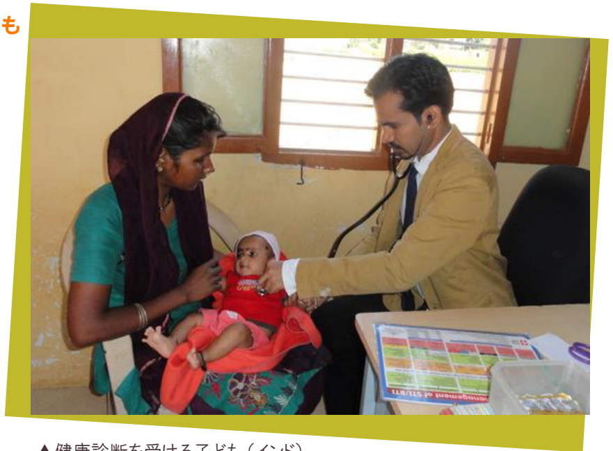
▲健康診断を受ける子ども（インド）

と周辺環境は、働く人や家族の健康にも影響を及ぼします。3、4年仕事をしてきた労働者たちの中には肺疾患を患う人が多くいます。また、子ども達も不衛生な環境と栄養不足によってさまざまな病気になるリスクにさらされています。