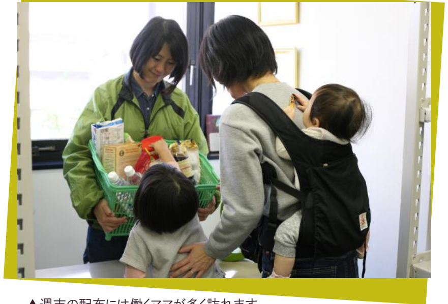
▲週末の配布には働くママが多く訪れます。

「子どもが『おなかすいた』と 言っているのに、食べさせてあげ られないことがありました。」 家族全員分のご飯が食卓に並ばな い家庭が日本にもあります。自分 の食事を抜くか、子どもにもがま んさせるか、悩むひとり親がいま す。私たちグッドネーバーズ・ ジャパンは「グッドごはん」を通 して定期的に食品の無料配布を行 うことで、子どもの健やかな成長 を支えています。